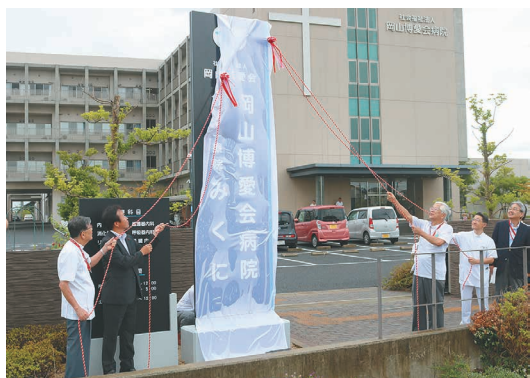
9月1日介護医療院みくにに除幕式の様子